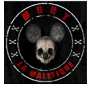
« Le célèbre Mickey Made in Frans »

« Je pense que l'action que j'ai vu, en direct est passée en détail dans le n°3 de la gazette, c'était cette fameuse action de Tarentuloïde, dans le match opposant Bilobobo à zOG-zOG. »