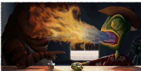
Cocha, toujours vivant, se préparant pour les demis !